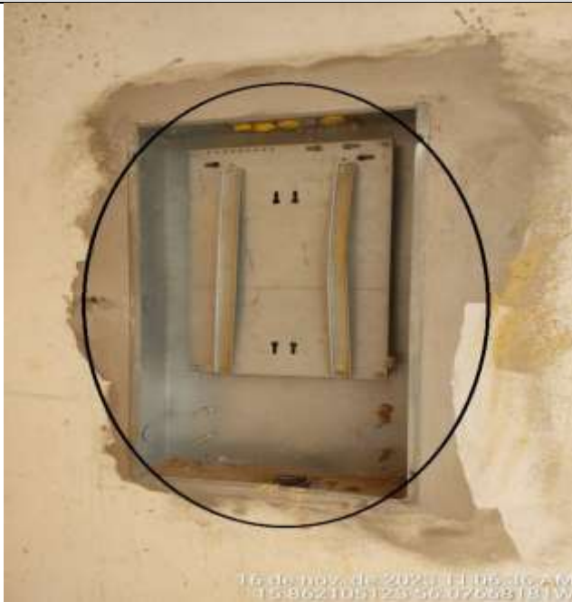
Figura 14 - Os quadros instalados na creche, estão danificados e sem a tampa frontal e os barramentos.