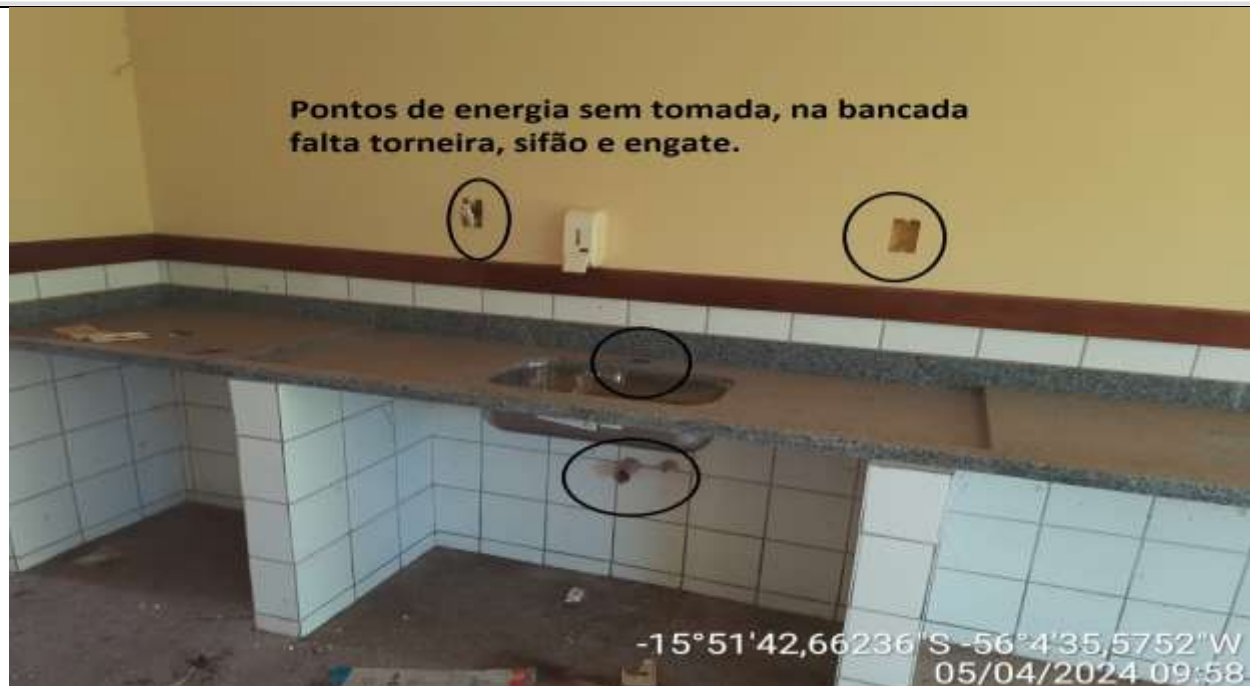
Figura 43 – Sala de aula