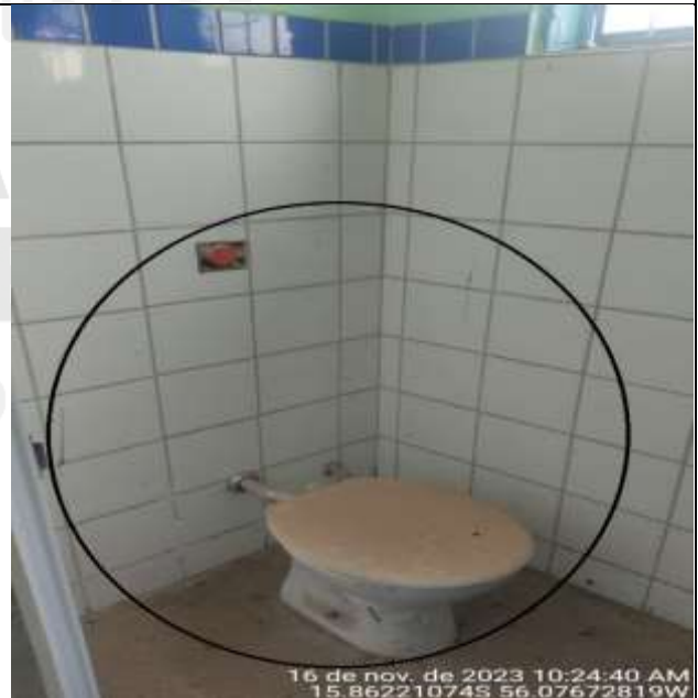
Figura 21 - Não houve a finalização do serviço.