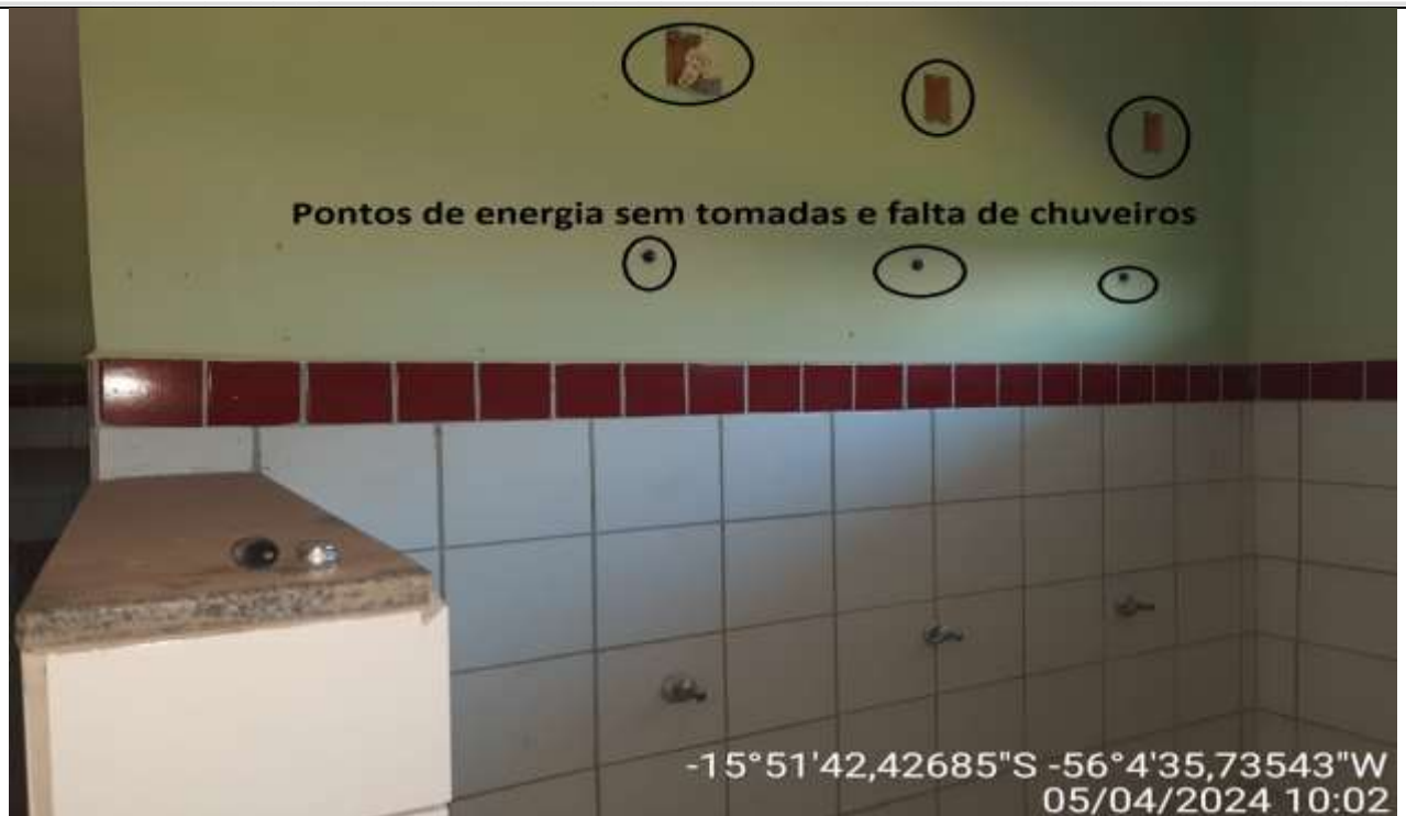
Figura 38 - Banheiro