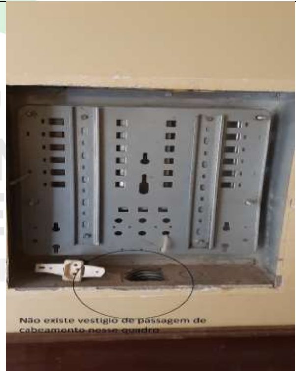
Figura 13 - Os quadros aparentam que nunca foi passado cabeamento por eles, inclusive não existe marcar na pintura que caracteriza tal fato.