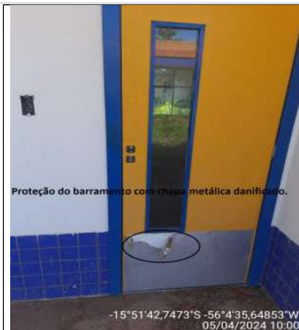
Figura 49 – vista externa da porta