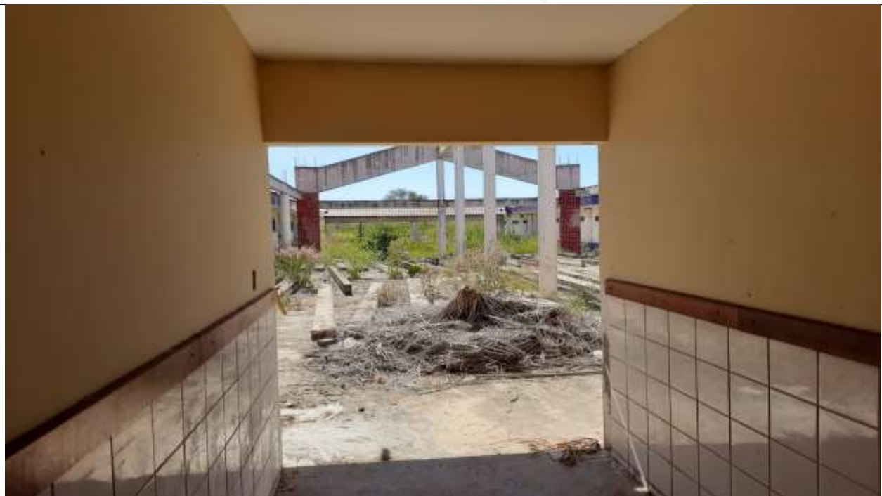
Figura 26 - Saída do Administrativo para o Pátio.