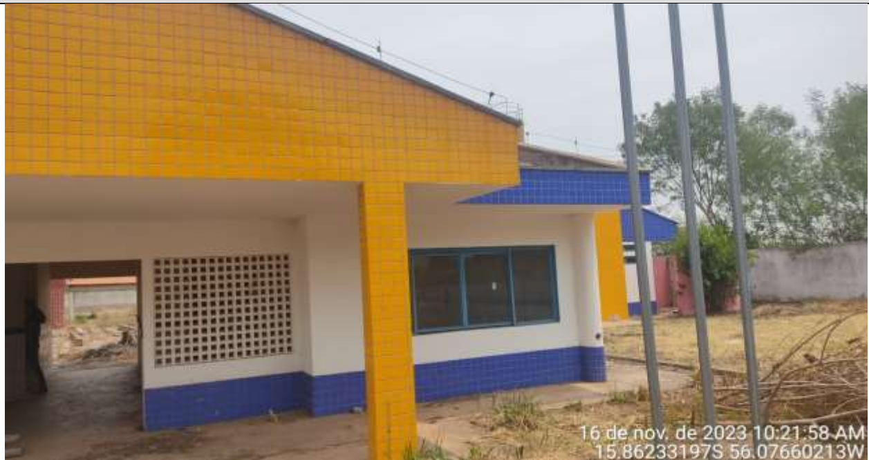
Figura 27 – Fachada lado direito