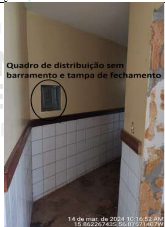
Figura 32 – Corredor Administrativo