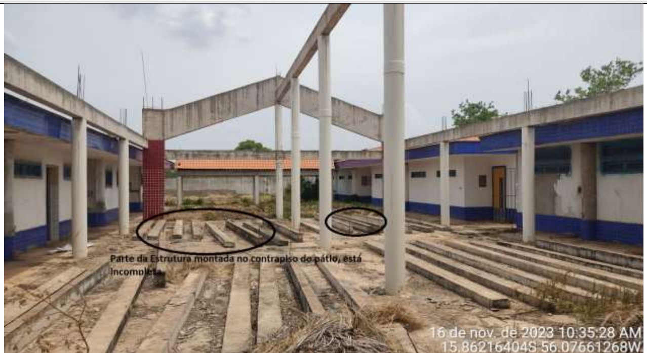
Figura 3 - Toda a estrutura de concreto para suportar a cobertura não está implantada no conjunto.