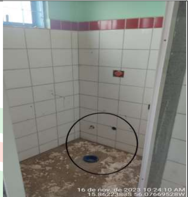
Figura 19 - Não houve a finalização do serviço.