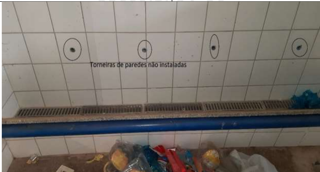
Figura 16 - A empresa não instalou todas as torneiras de parede, mais o serviço já foi pago.