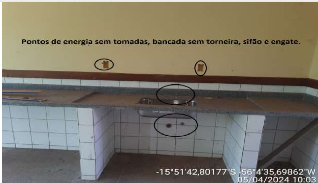
Figura 36 – Vista interna da sala de aula