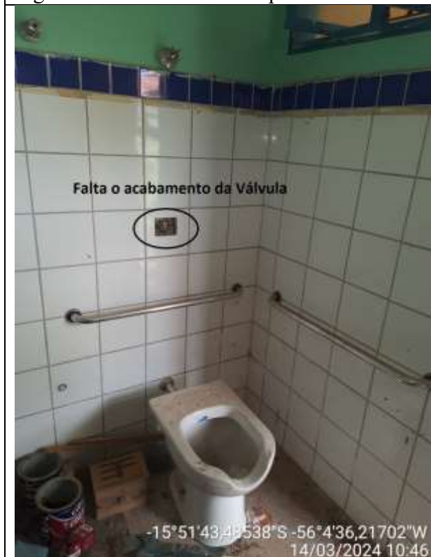
Figura 51 - Banheiro