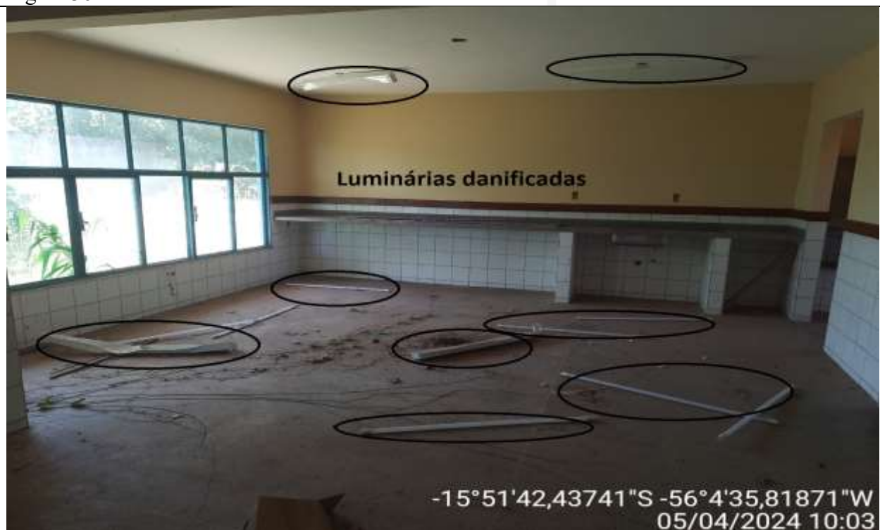
Figura 37 – Vista interna da sala de aula