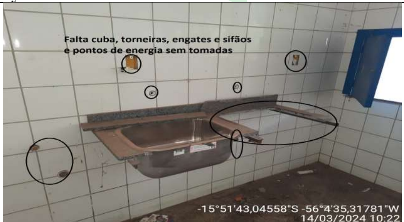
Figura 54 - Cozinha