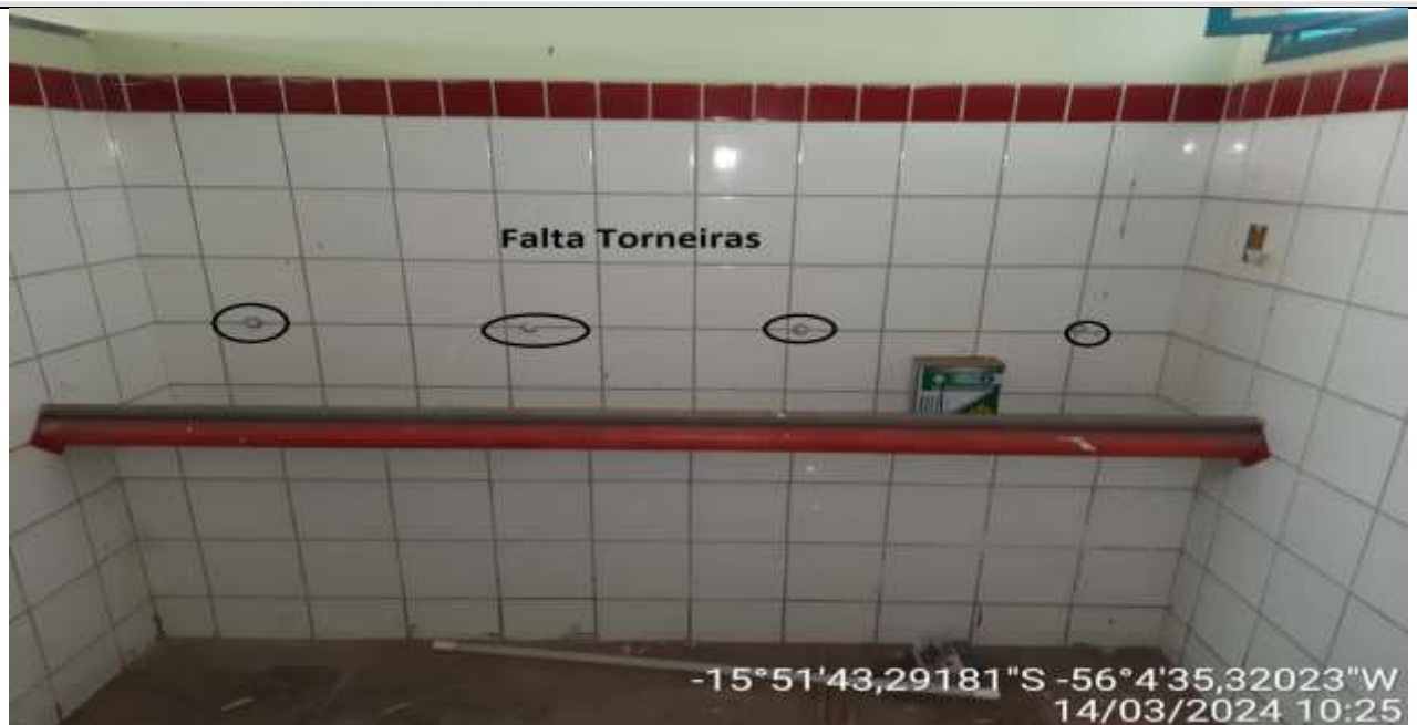
Figura 55 - Banheiro