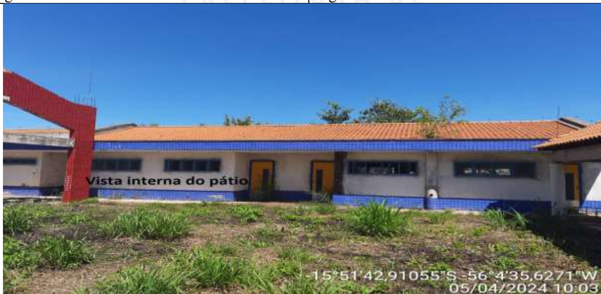
Figura 35 – vista interna do pátio