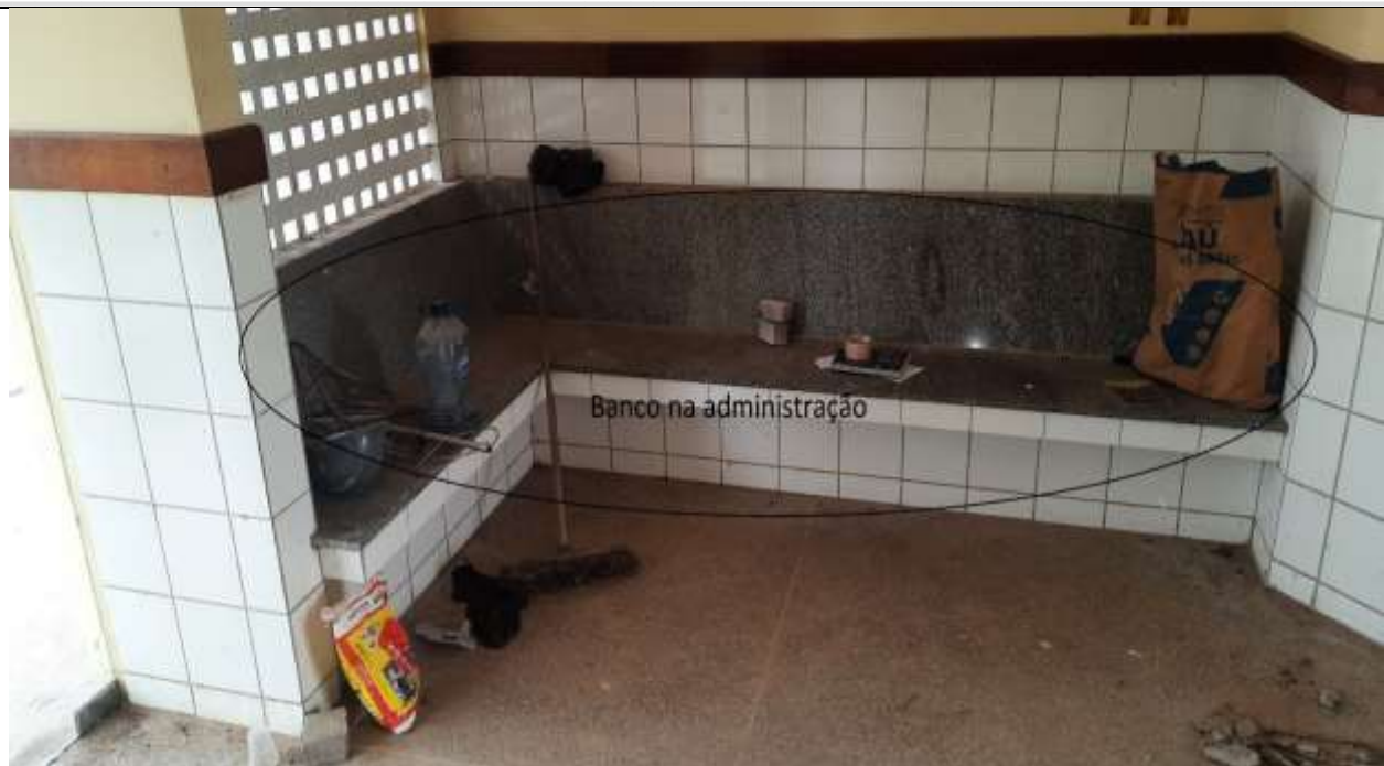
Figura 17 - Banco no setor administrativo.