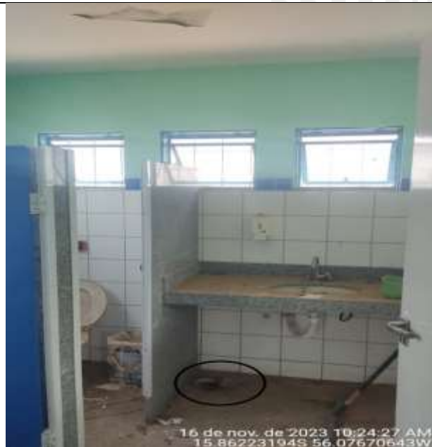
Figura 20 - Não houve a finalização do serviço.