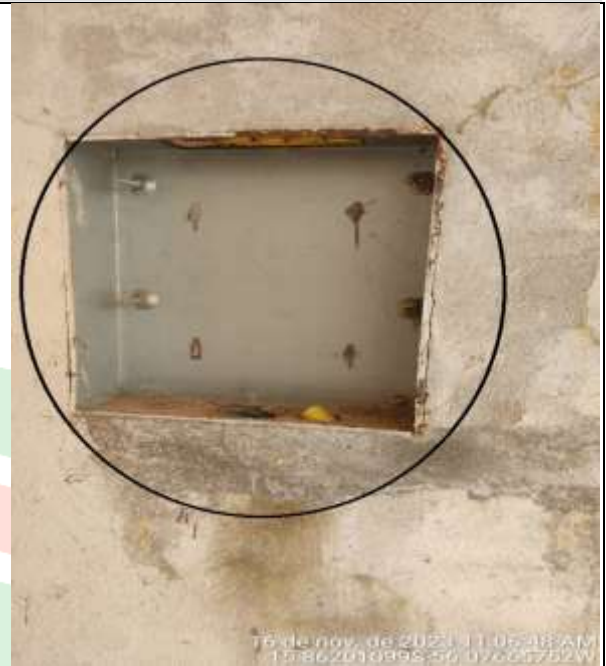
Figura 15 - Os quadros instalados na creche, estão danificados e sem a tampa frontal e os barramentos.