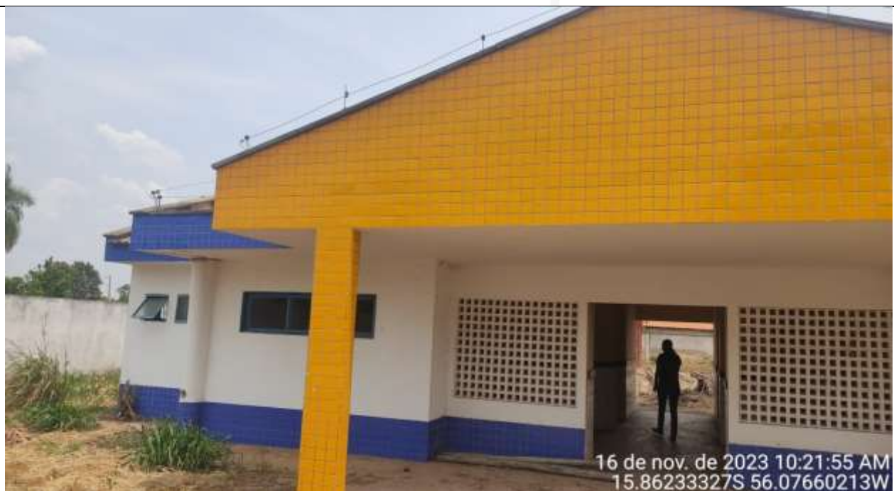
Figura 28 - Fachada lado esquerdo