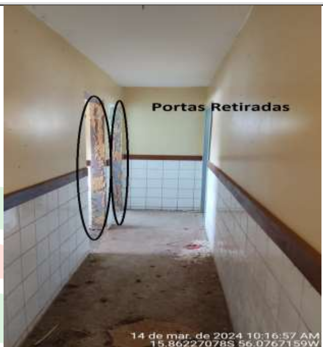
Figura 50 – vista do corredor da administração