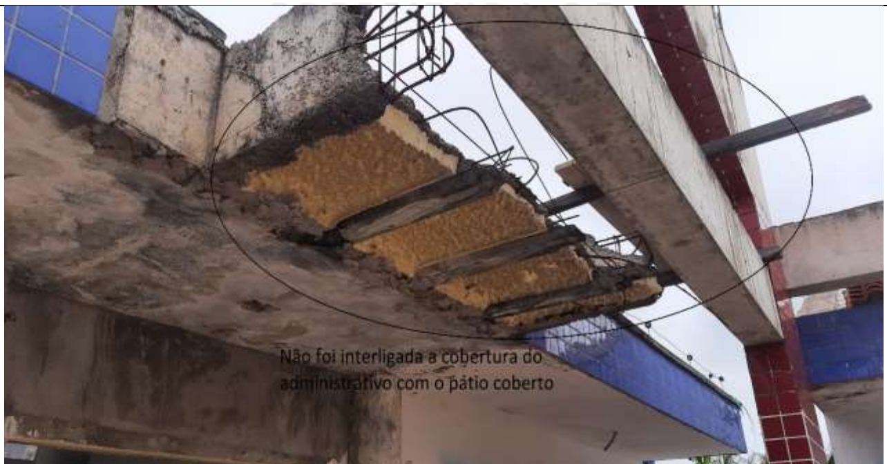
Figura 4 - Não houve a interligação do setor administrativo com o pátio coberto