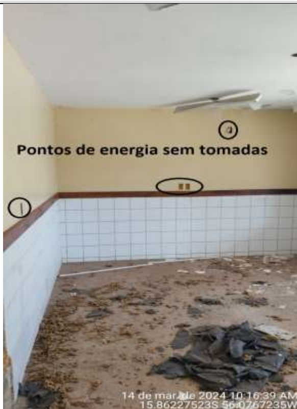
Figura 33 - Administrativo