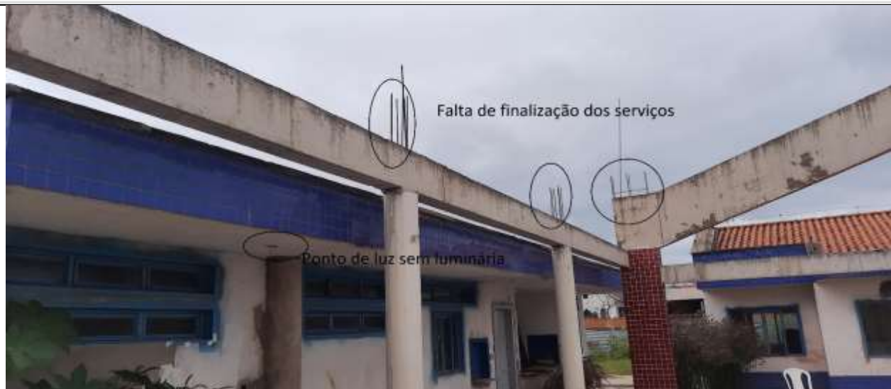
Figura 11 - Falta de acabamento no pátio coberto e ponto de luz sem luminária.