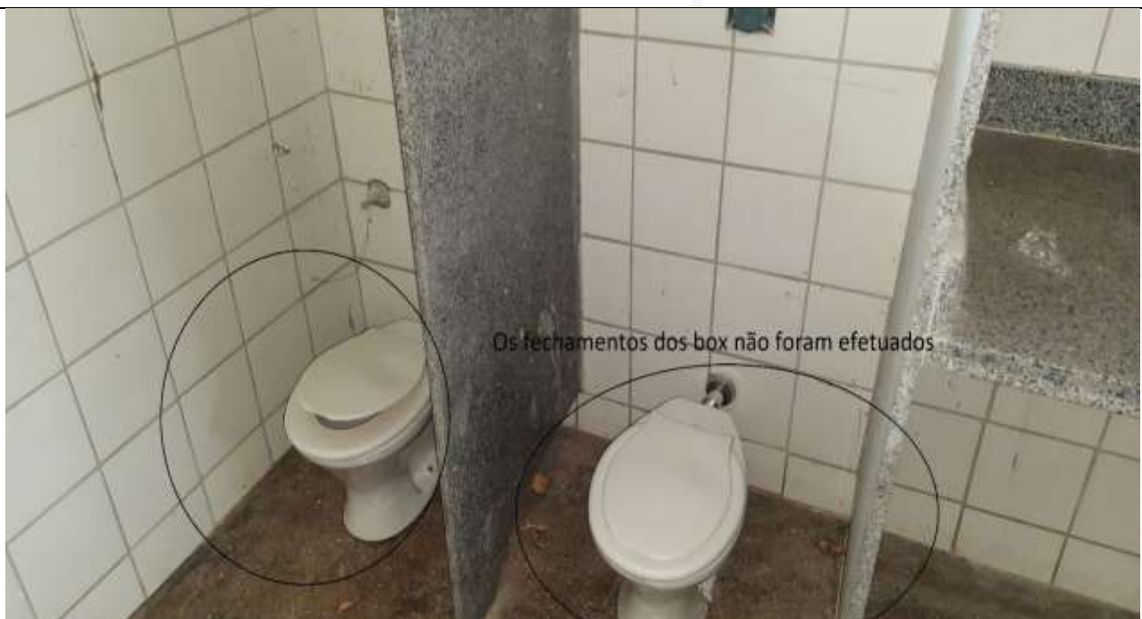
Figura 23 - Não houve a finalização do serviço.