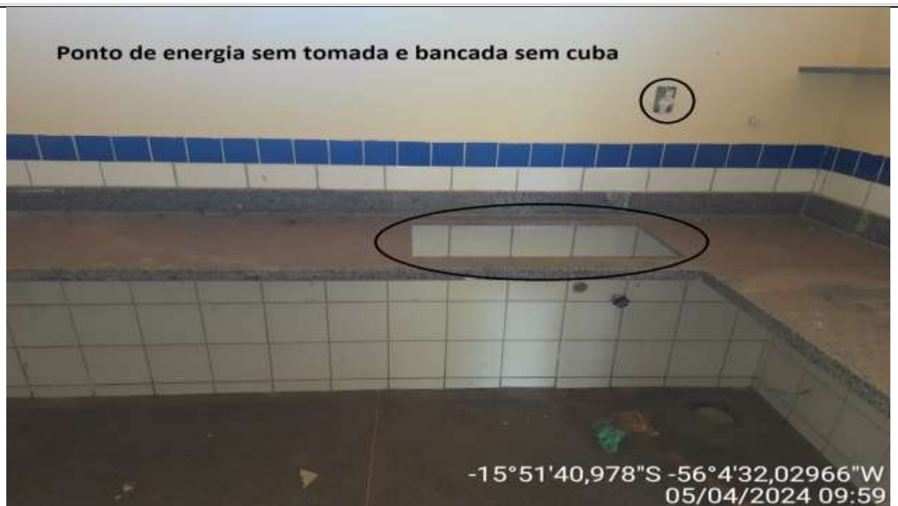
Figura 45 – Sala de aula