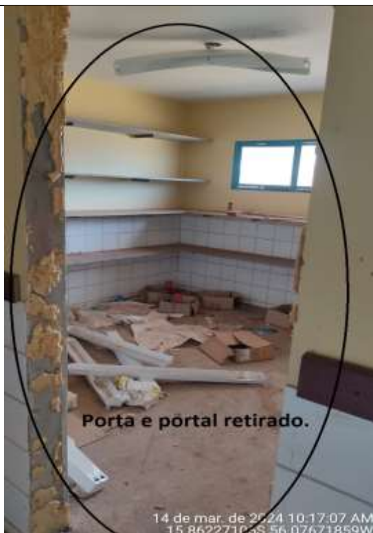
Figura 31- Administrativo