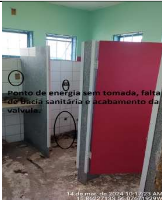
Figura 29 - Banheiro