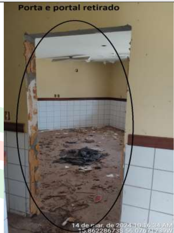
Figura 34 - Administrativo