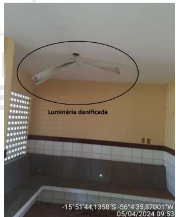
Figura 42 - Administração