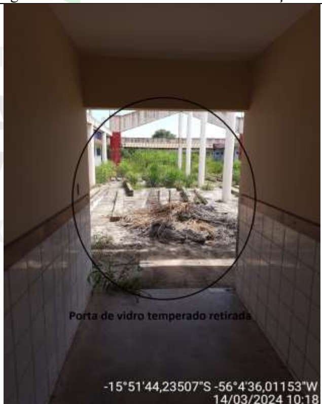
Figura 52 – Entrada do pátio interno