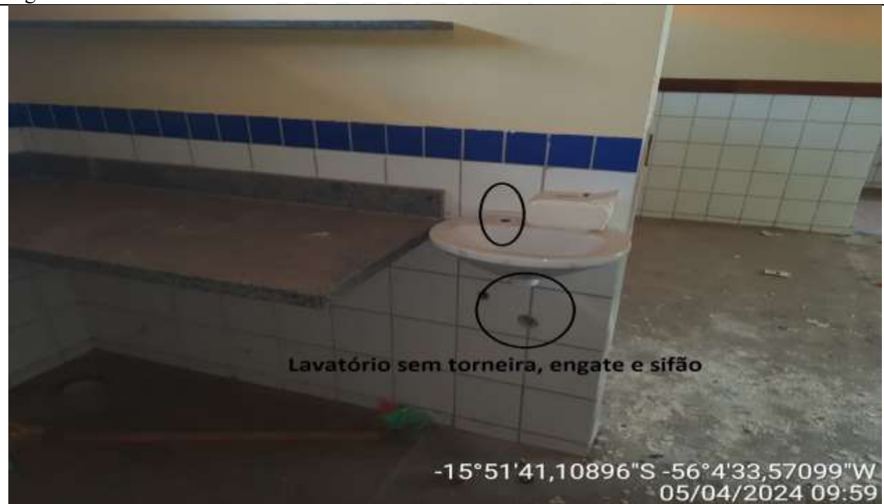
Figura 48 – Sala de aula