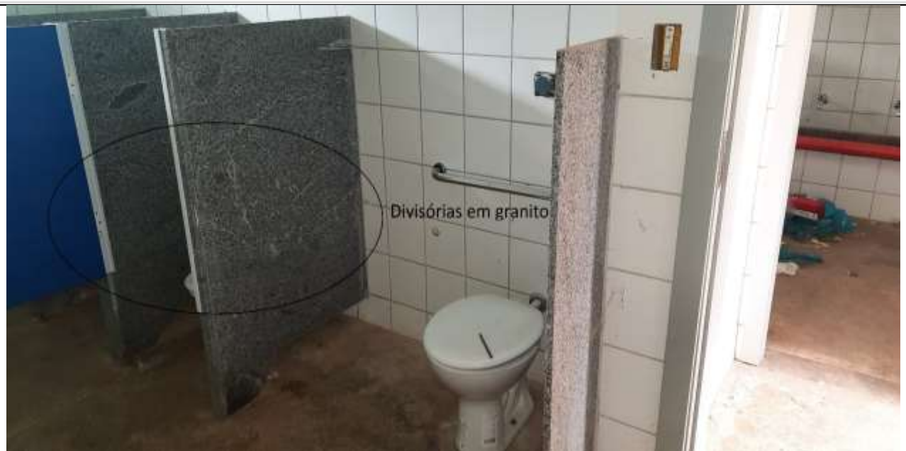
Figura 22 - Divisórias em granito dos boxes dos banheiros, ficou sem fechamento. E houve um erro de execução dos boxes dos vasos sanitários, não seguiu o projeto.