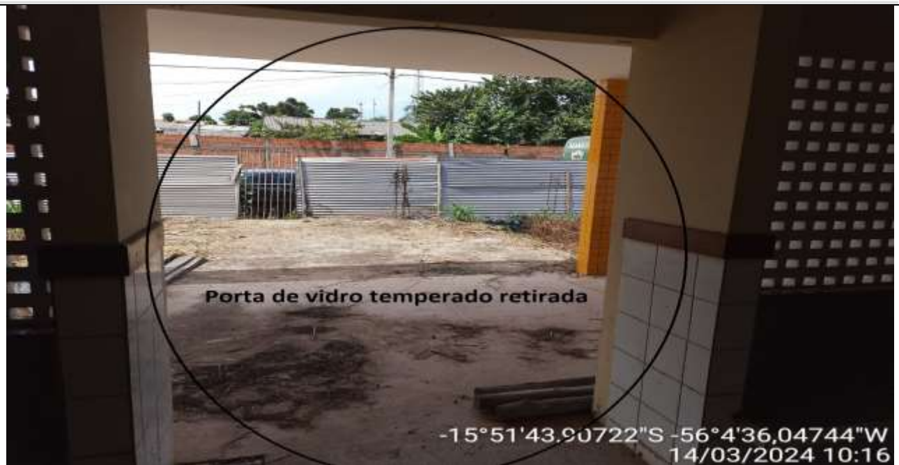
Figura 53 – Entrada da Creche