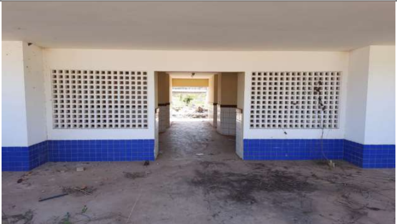
Figura 24 - Entrada Principal do Administrativo.