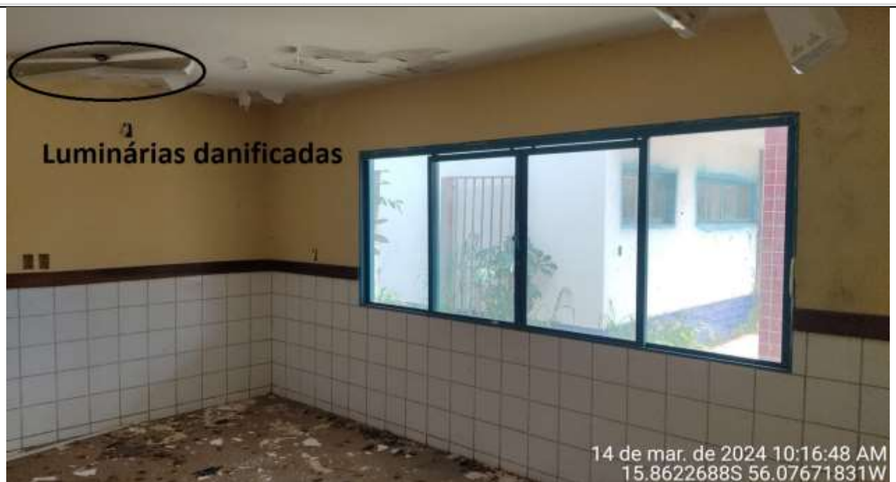
Figura 40 – Sala de aula