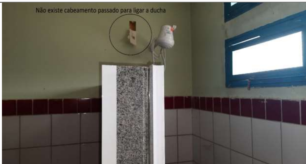
Figura 7 - Comprovação que não existe cabeamento passado para alimentar duchas ou chuveiros.