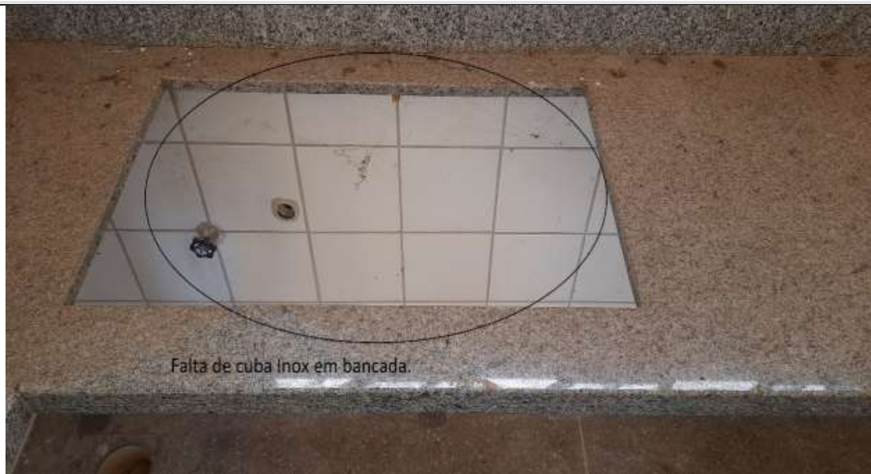
Figura 5 - Bancada sem cuba inox.