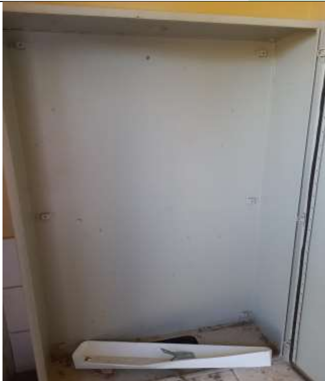
Figura 12 - Quadro implantado, somente a caixa.