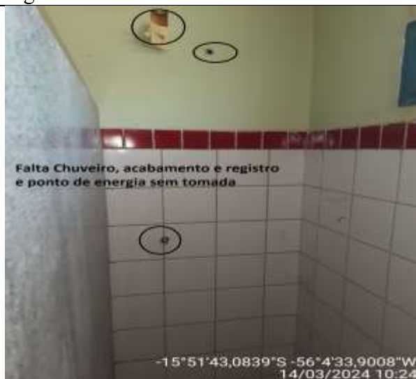
Figura 56 - Banheiro