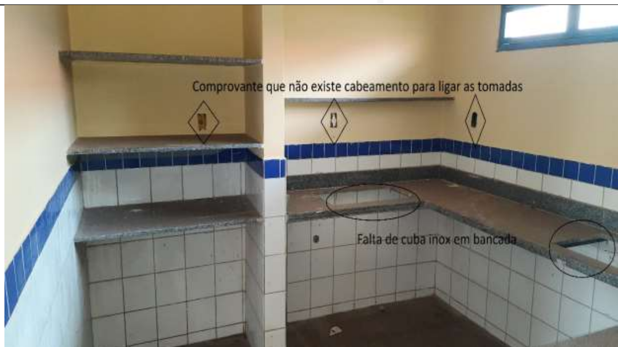
Figura 8 - Falta de cuba Inox em bancada e comprovação de falta de cabeamento para ligar as tomadas.