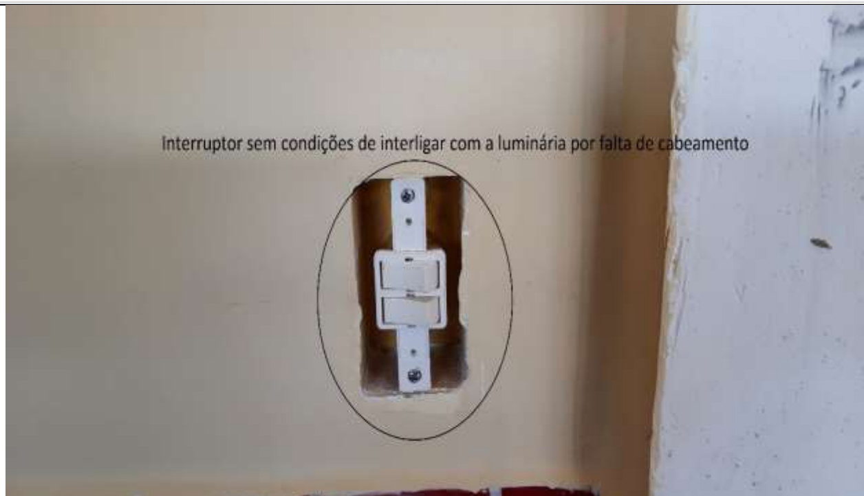
Figura 9 - O interruptor não está instalado, pois não tem cabeamento de ramal de energia.