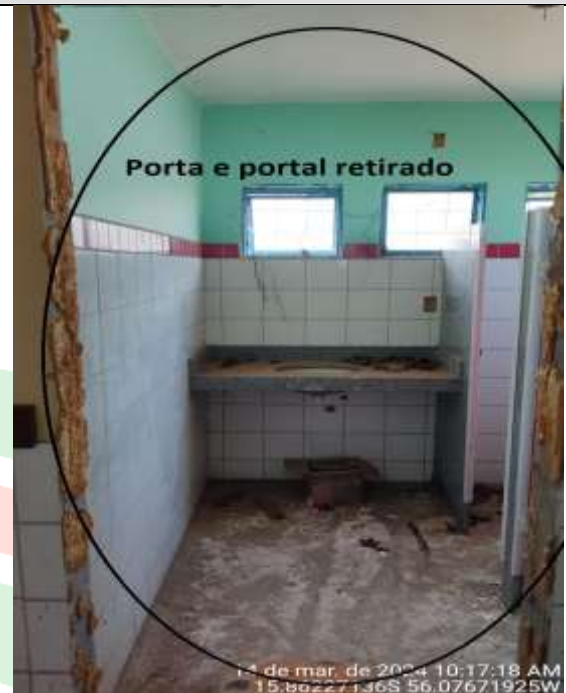
Figura 30 - Banheiro