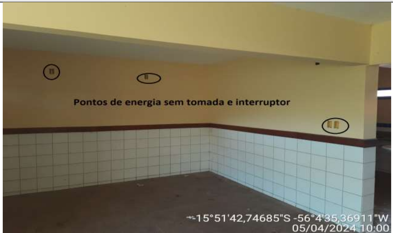
Figura 47 – Sala de aula