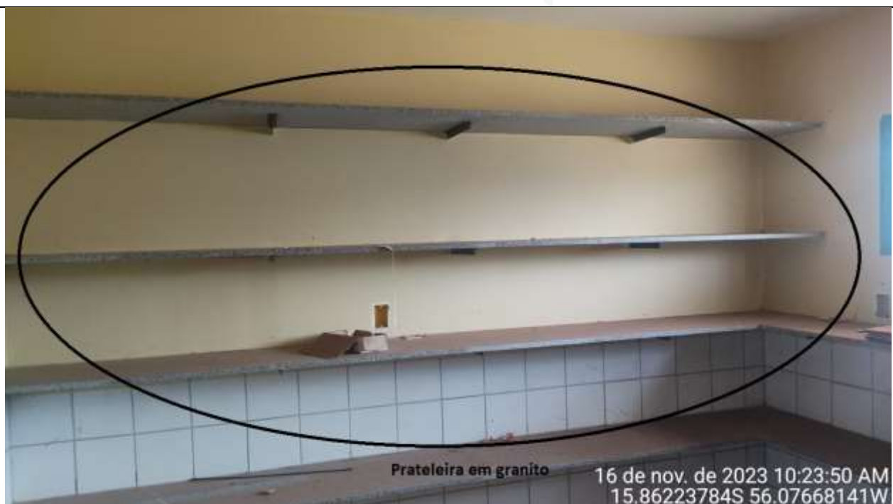
Figura 18 - Prateleira no almoxarifado.