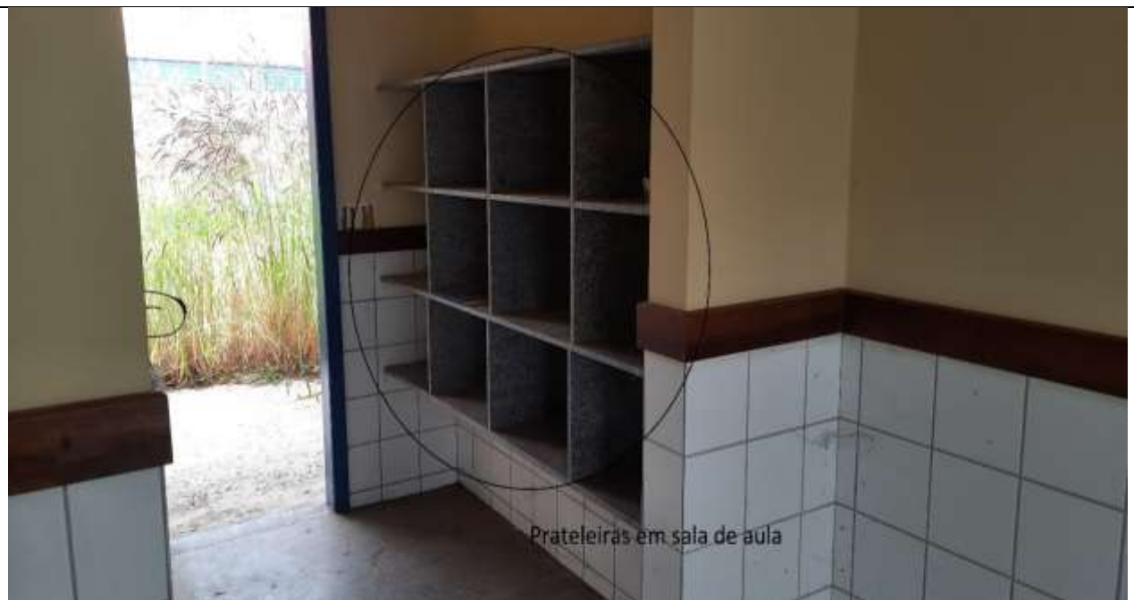
Figura 26 - Prateleira em sala de aula.