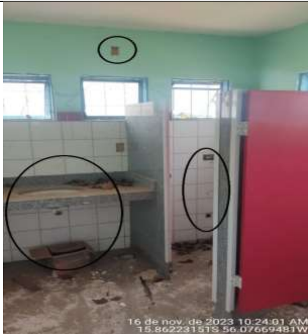
Figura 19 - Pia sem sifão e torneira, tomada alta e média sem fiação e não houve instalação dos vasos sanitários.