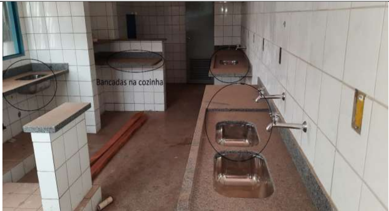
Figura 25 - Bancadas na cozinha.