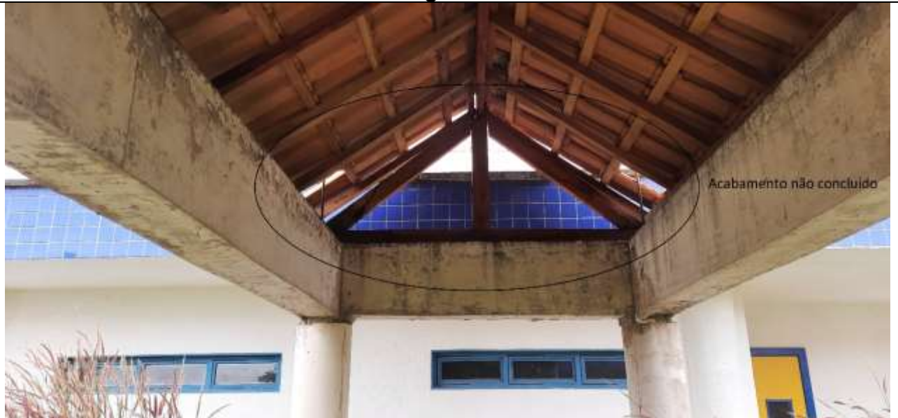
Figura 1 - Não tem acabamento de interligação entre a passarela e o bloco.