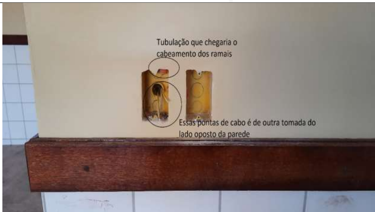
Figura 6 - Comprovação que não existe cabeamento passado para alimentar as tomadas.