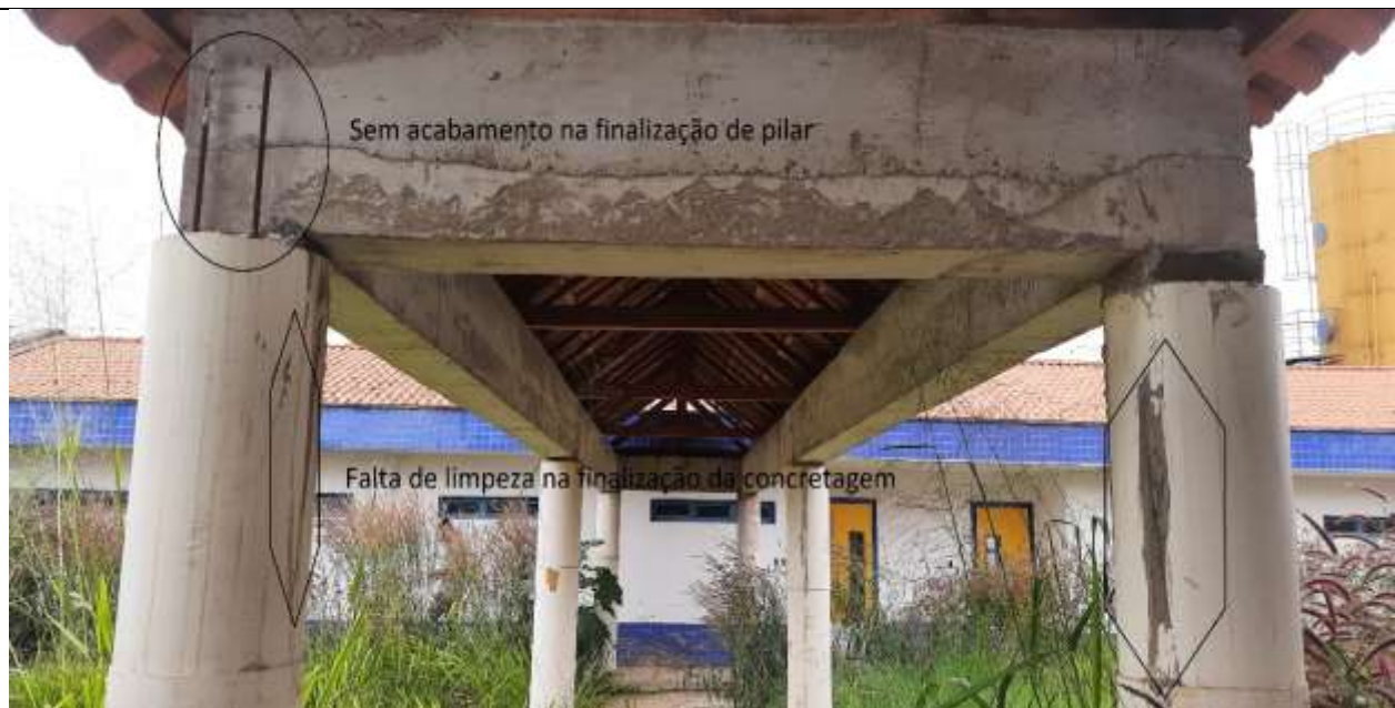
Figura 10 - Não tem acabamento na finalização dos pilares da passarela e na concretagem deixaram o concreto que escorreu secar na tubulação de forma, esses serviços já foram pagos.